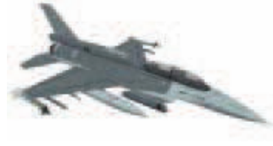
F-16D Singapore Fighter