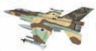
F-16D Israeli Fighter

Facets模型可用于特定国家标识和色彩配置。下图显示使用多种配置的一个标准F-16模型。