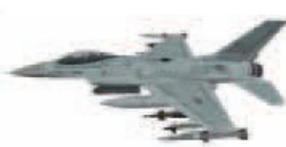
KF-16C Korean Fighter