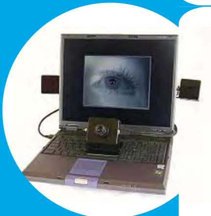
EyeTech Digital Sys