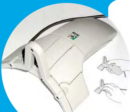
Logitech 3D Mouse